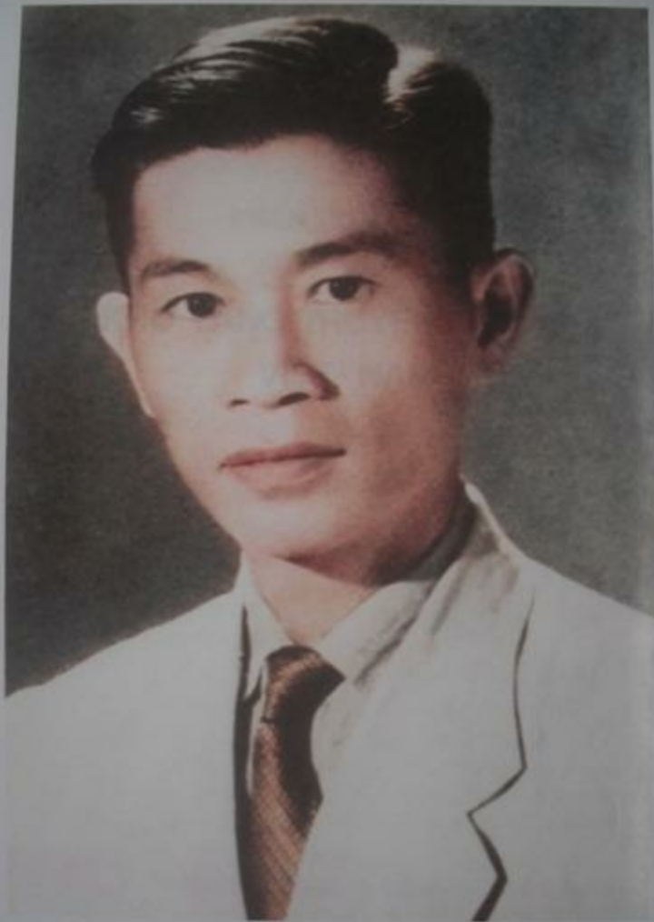
CHÂN DUNG TÁC GIẢ NĂM IN KHO TÀNG TRUYỀN CỔ TÍCH VIỆT NAM (1958)

* Chân dung tác giả (Họa sĩ Diệp Minh Châu vẽ, 1981)